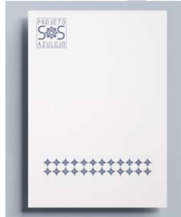
Papel de carta