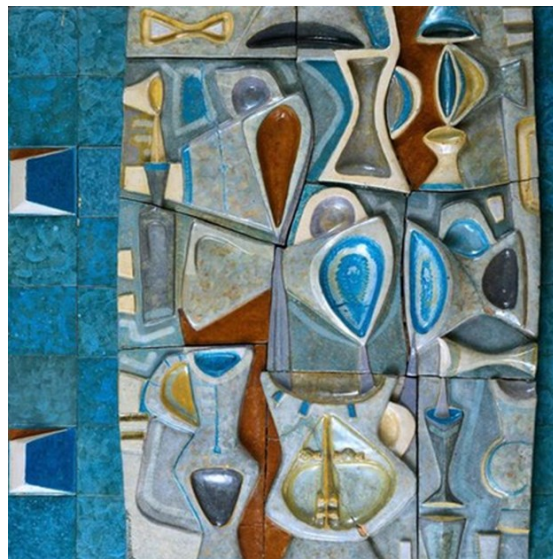
Querubim Lapa - pormenor do revestimento do Pavilhão de Portugal, Comptoir Suisse, Lausanne - Suíça, 1957.