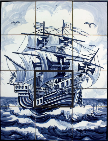
O quadrado utilizado no folheto