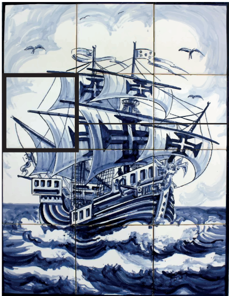
O quadrado utilizado no post para as redes sociais